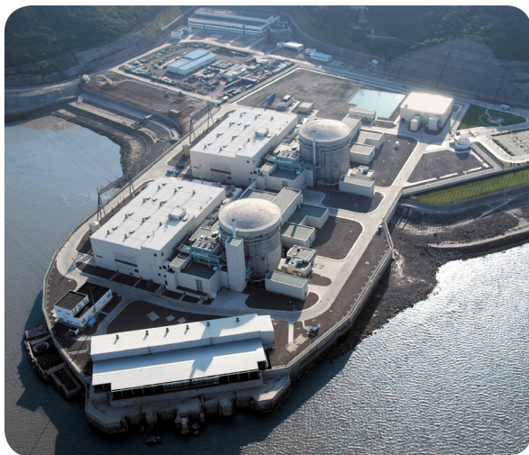
Bild 1: Das auf der bewährten VME Technologie basierende Sicherheitsabschaltsystem 2 (SDS 2) überwacht die sicherheitskritischen Parameter im Qinshan Phase III Kernkraftwerk in China.

Das weltweit erste zivile Kernkraftwerk ging 1954 in Obninsk, UdSSR ans Netz. Der Reaktor produzierte rund fünf Megawatt, was damals ausreichte, um 2.000 Haushalte mit Strom zu versorgen. Mittlerweile decken weltweit 435 Kernkraftwerke in 31 Ländern rund 17 % des weltweiten Strombedarfs. Für den sicheren Betrieb, erfordern Kernkraftwerke Sicherheitssysteme mit extrem hoher Verfügbarkeit. Ein Vorreiter bei der Erforschung der Nuklearsicherheit ist das Unternehmen AECL. Gegründet 1952, hat AECL die CANDU® (Canada Deuterium Uranium) Reaktortechnologie mitsamt dem CANDU 6® Reaktor entwickelt – einer der weltweit leistungsstärksten Kernkraftreaktoren. Zu den Sicherheitseinrichtungen des Reaktors gehören zwei voneinander unabhängige höchst betriebssichere Abschaltssysteme, SDS1 und SDS2 (Safety Shutdown System), die den Reaktor bei einem Störfall automatisch abschalten. Die Steuerung des Sicherheitsabschaltsystems SDS2 von AECL verfügt über eine elektronische Steuerung auf Basis der bewährten VME Technologie.