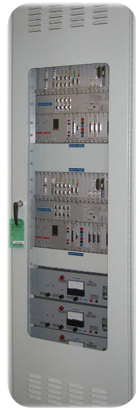
Bild 2: Einer der robusten Kontron PDCs zur Überwachung von sicherheitskritischen Werten im CANDU Reaktor

Bevor das System an AECL übergeben werden konnte, haben unabhängige Experten alle in den PDCs verwendeten Kontron Boards rigoros auf ihre Tauglichkeit hinsichtlich Erdbebensicherheit, EMV, Temperaturverträglichkeit, Schock und Vibration getestet. Dieses „proof of concept“-Verfahren garantiert, dass jedes Bauelement auch unter widrigsten Umständen betriebstüchtig bleibt. Kontron hat außerdem Factory Acceptance Tests (FAT) im Beisein von AECL Mitarbeitern an seinem Standort in Kaufbeuren in Deutschland durchgeführt, um die Funktionalität jedes einzelnen Boards und Bauelements sicherzustellen. Nach Auslieferung des Safety Shutdown Systems, testete AECL nochmals die Funktionalität aller Bauteile vor Ort,